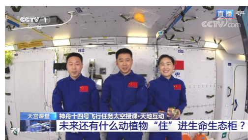
10月12日15时45分，固原市实验小学全体师生通过中央广播电视总台现场直播，收看了“天宫课堂”第三课。

太空授课活动采取天地互动方式进行，神舟十四号飞行乘组3名航天员陈冬、刘洋、蔡旭哲面向广大青少年进行太空授课。师生观看了在轨航天员在中国空间站问天实验舱工作生活场景，微重力环境下毛细效应实验、水球变“懒”实验、太空趣味饮水、会调头的扳手以及植物生长研究项目，“天宫课堂”与地面课堂进行互动交流的场景。