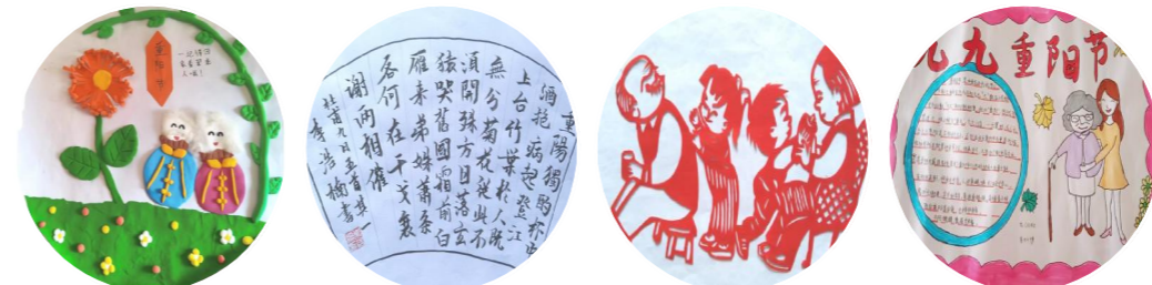
重阳主题手工制作 重阳主题书画 重阳主题剪纸 重阳主题风俗

通过开展“德润童心 情满重阳”主题活动，大力弘扬了优秀传统文化，丰富了中华民族传统节日的内涵，同时也进一步激发了广大师生学习中华优秀传统文化的热情，增强了民族自信心、自尊心和自豪感。