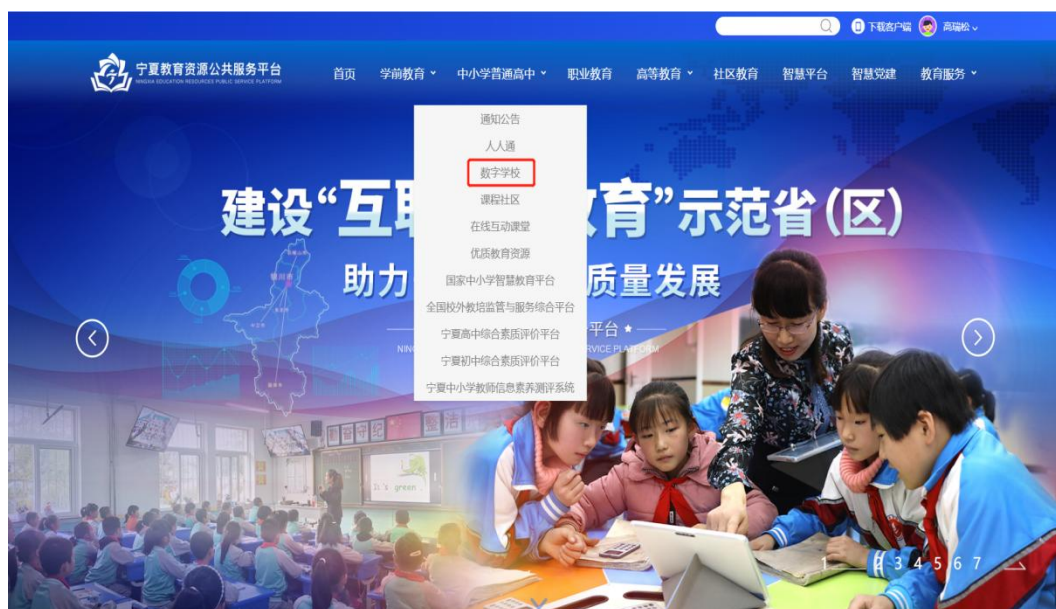
宁夏教育资源公共服务平台

(一) 通过浏览器访问“宁夏教育资源公共服务平台”网址“https://www.nxeduyun.com/”，进入选择导航栏【中小学普通高中—数字学校】，登录教师个人账号后点击头像下方【个人空间】，进入后台选择【在线课堂】模块。