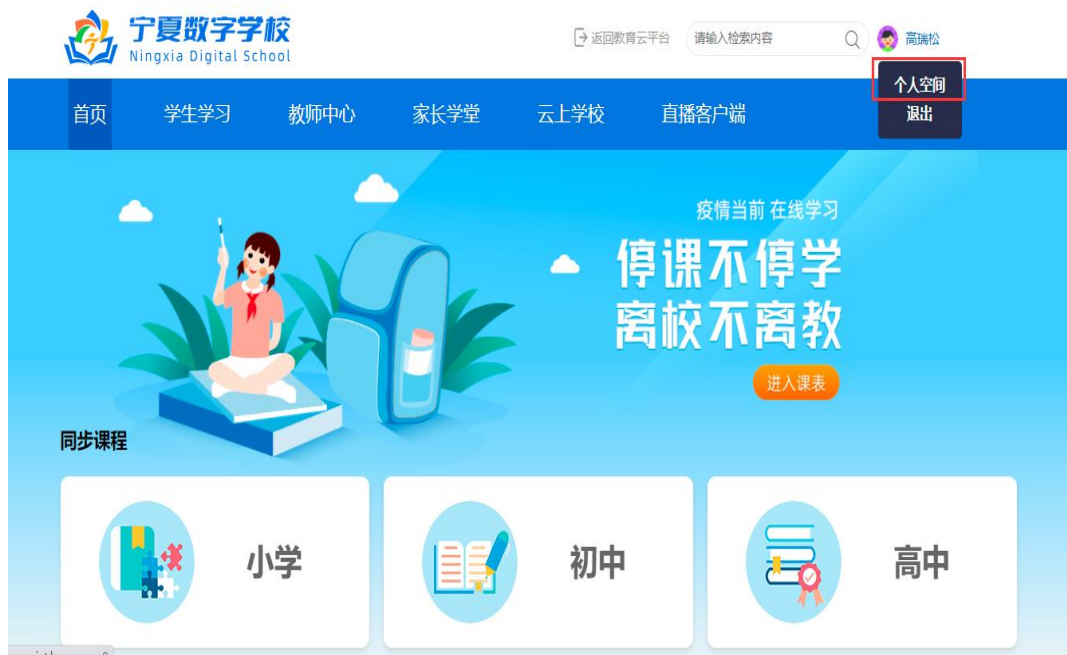
宁夏数字学校首页