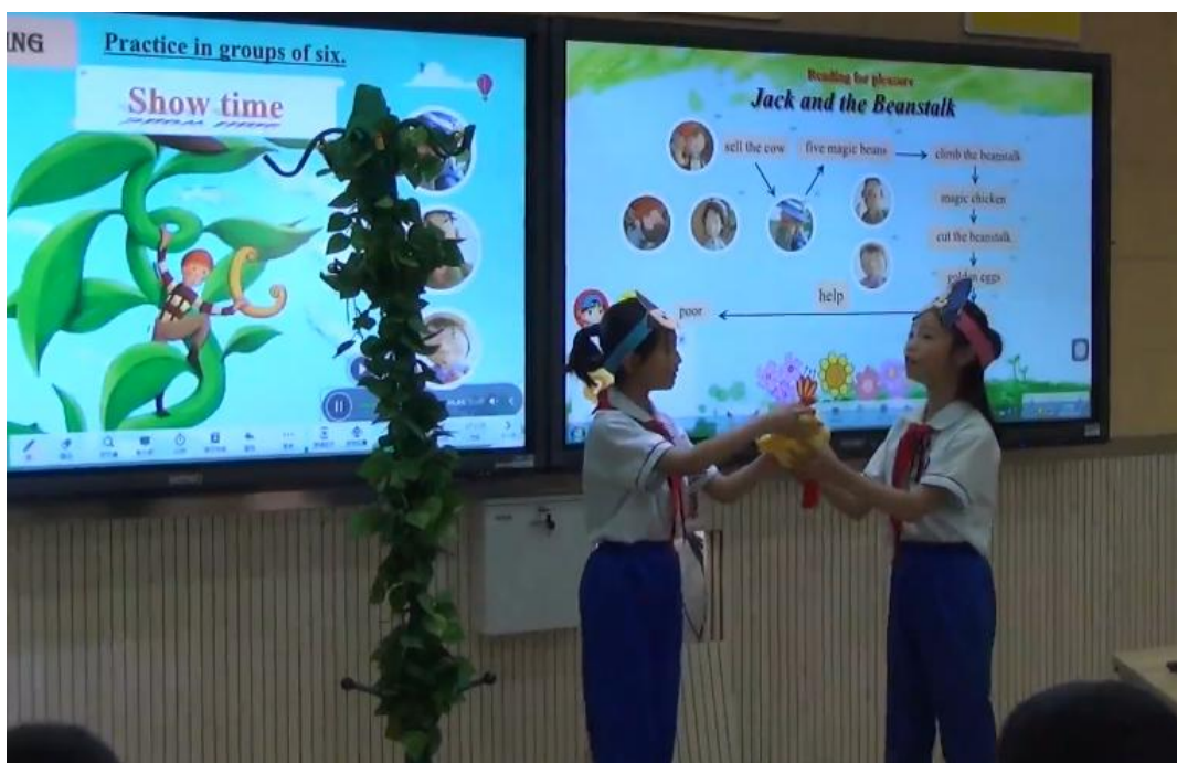
图 10 学生表演绘本