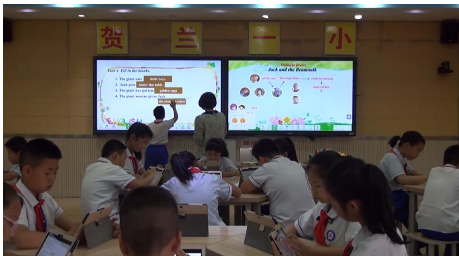
图 6 学生利用平板电脑进行填空练习