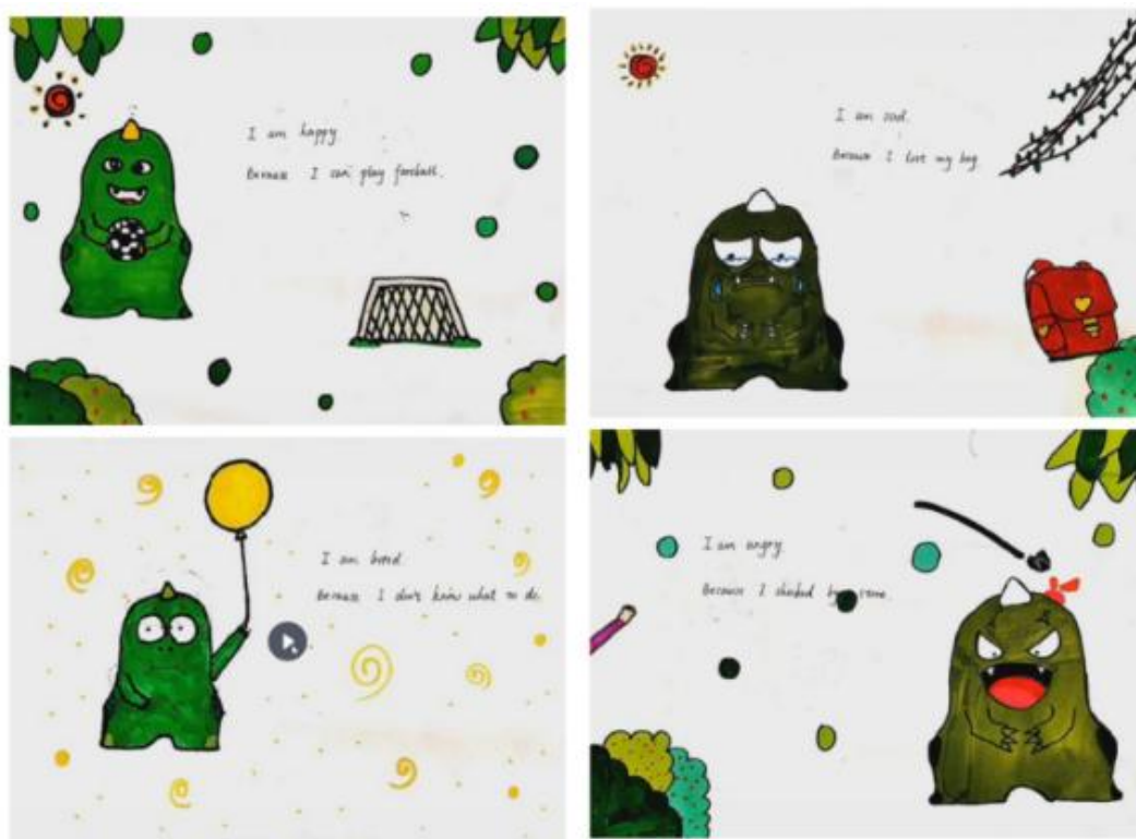
图 12 课后学生自制情绪绘本