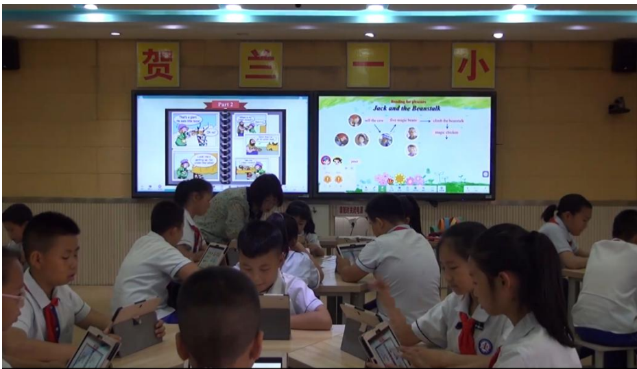
图 5 学生利用平板电脑进行 Part2 课文学习，圈出关键信息

② 让学生通过平板电脑对 Part2 进行文本学习，利用了“理想智慧云”中的“备课助手”进行制作，通过网络上传到学生平板终端，学生在平板电脑上进行故事阅读，代替了传统课文学习。利用智能笔在平板上进行勾画，圈出关键信息。并且利用白板软件同学生电脑进行互动学习，学生通过平板电脑进行填空练习，深度理解绘本故事。