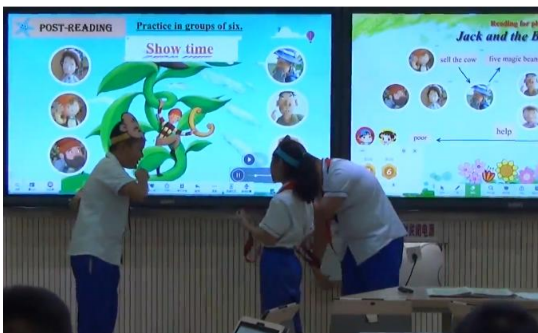
图 11 学生表演绘本