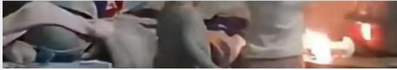
姐弟俩竟拿易燃物灭火! ? 监控记录下惊险一幕